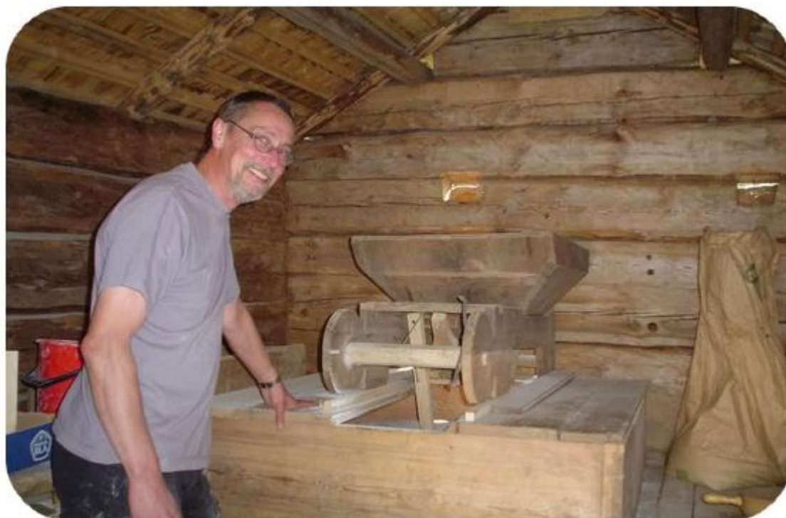
Malning och försäljning av mjöl