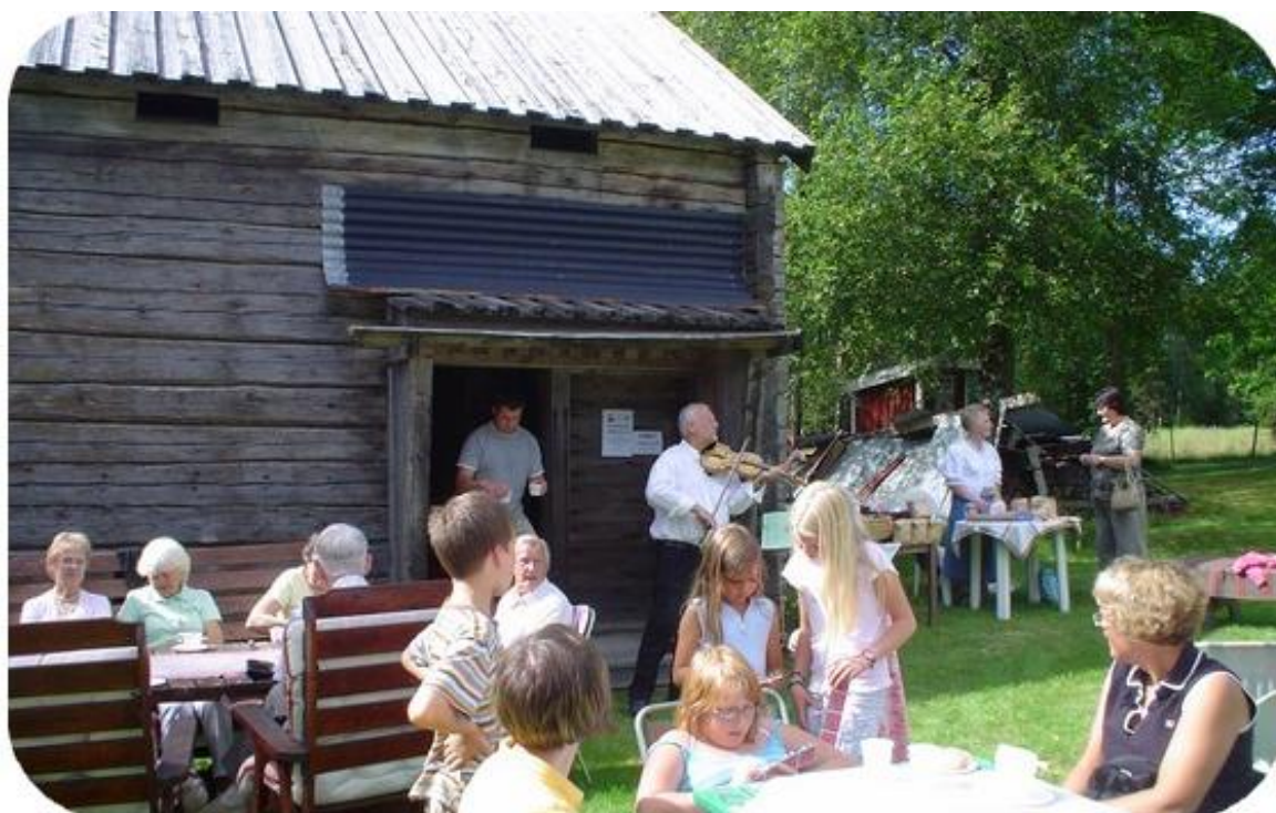
Kvarnkafé med musikunderhållning